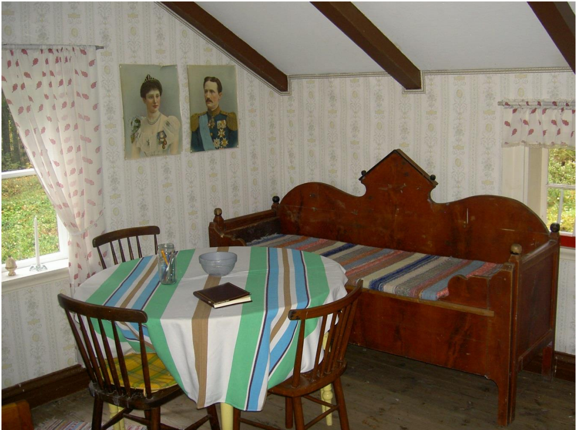
Sydvästra hörnan av rummet. På väggen Prins Karl och Prinsessan Ingeborg.

Stugan består av "Ett rum och kök"- här föddes 8 barn 1877-93!