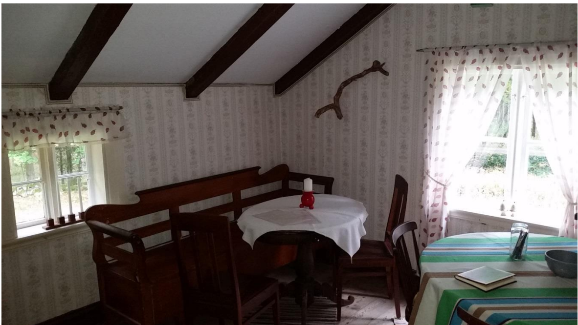
Sydöstra hörnan av rummet.