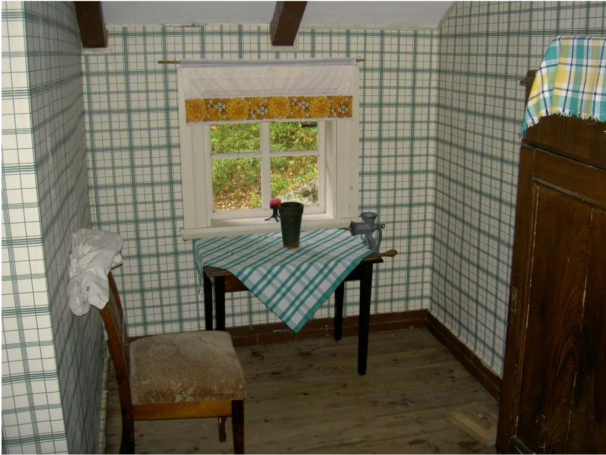
Köket mot väster.