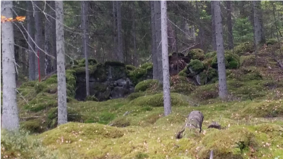
Torpruinen i Högaböke där "Kålla-Haukene" växte upp.