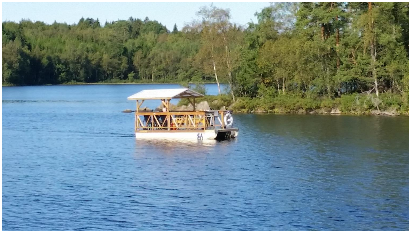
Redan vid 9- tiden stävade det eldrivna flytetyget "SA 001", med hemmahamn Öjasjön- Norra Hamnen, fram över sjön. Det angjorde Öjasjön- Södra Hamnen, och lade till vid flytbryggan där vår båt- och grillplats är belägen.

Nedan följer några bilder från "Den Perfekta Dagen vid Öjasjön"!