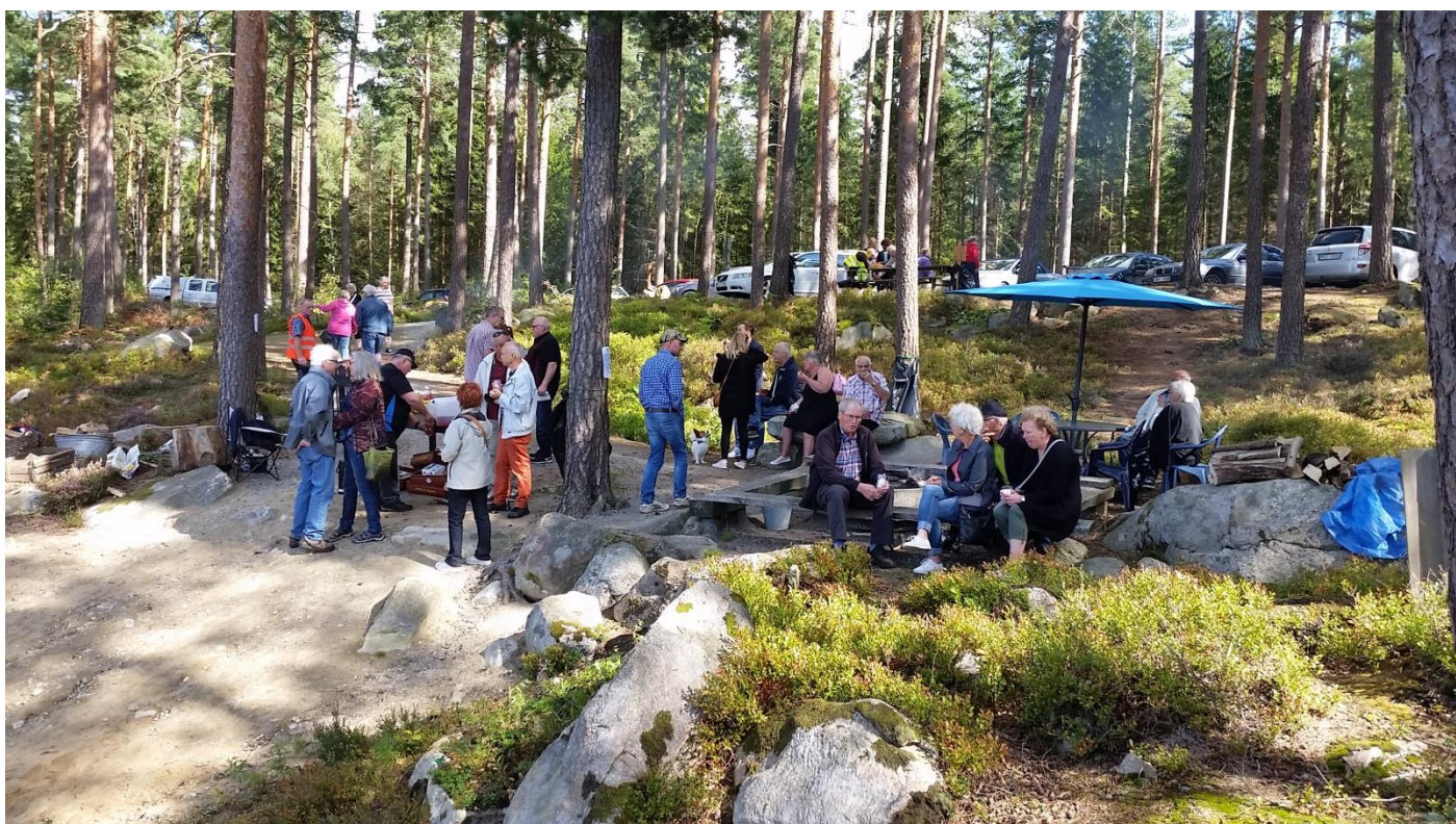
Mellan kl. 11 och 14 toppade det med besökare. Grillarna var glödheta och personalen jobbade för fullt...