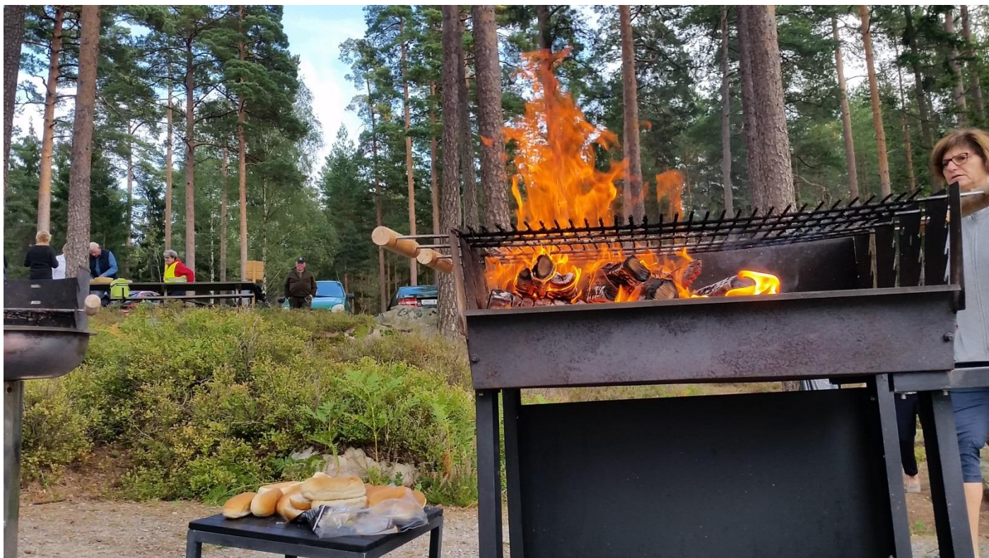
En korvgrillares vy: Med elden i fokus och "glöd i både grill och sinne". Ryggen mot sjön och med parkeringsplatsen och lotteriförsäljningen i bakgrunden- uppför slätten.