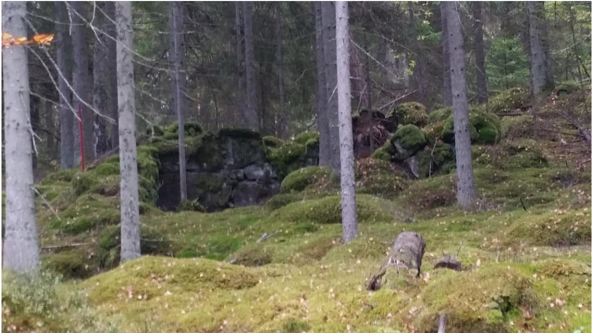
Torpruinen i Högaböke där "Kålla-Haukene" växte upp.