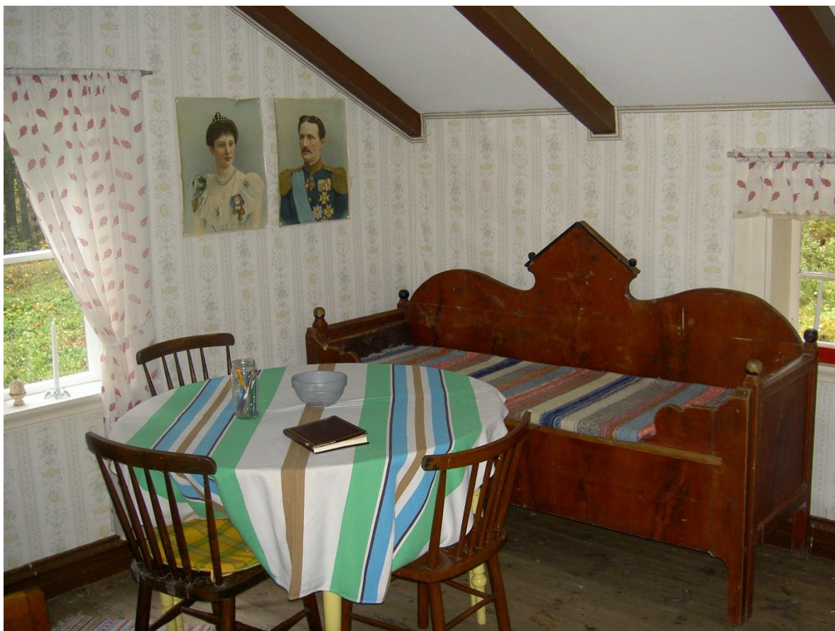
Sydvästra hörnan av rummet. På väggen Prins Karl och Prinsessan Ingeborg.

Stugan består av "Ett rum och kök"- här föddes 8 barn 1877-93!