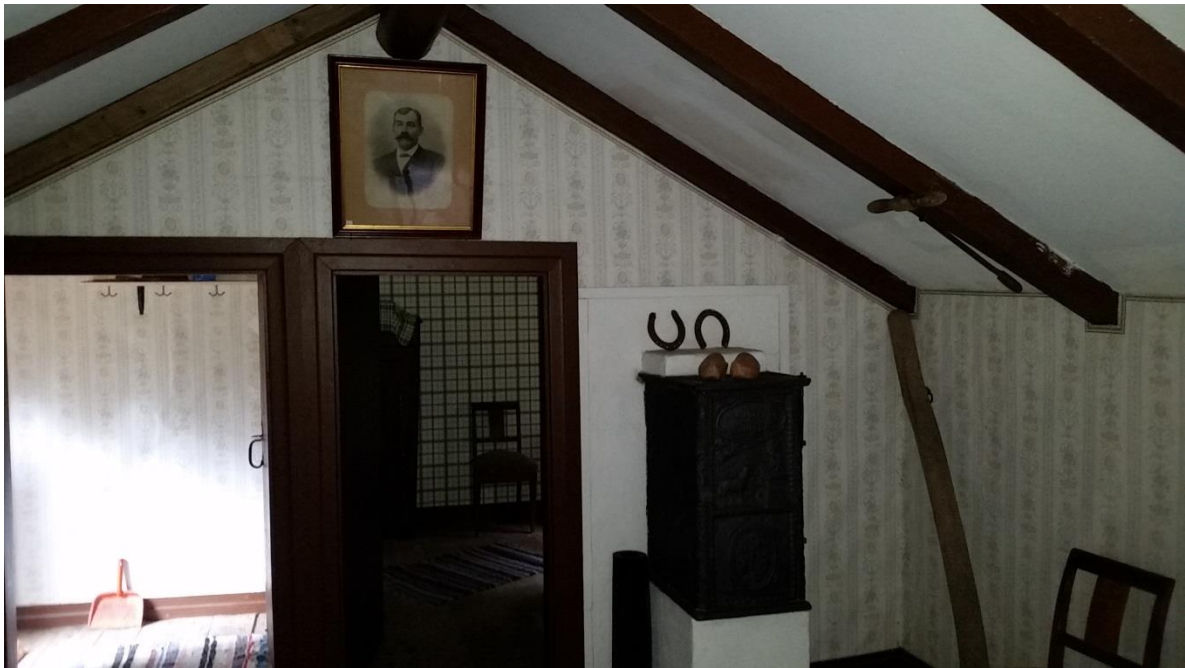
Norra gaveln av rummet mot köket- till höger. Farstun syns till vänster. Farstun har dörr både mot rum och kök. Notera porträttet över dörrpost.