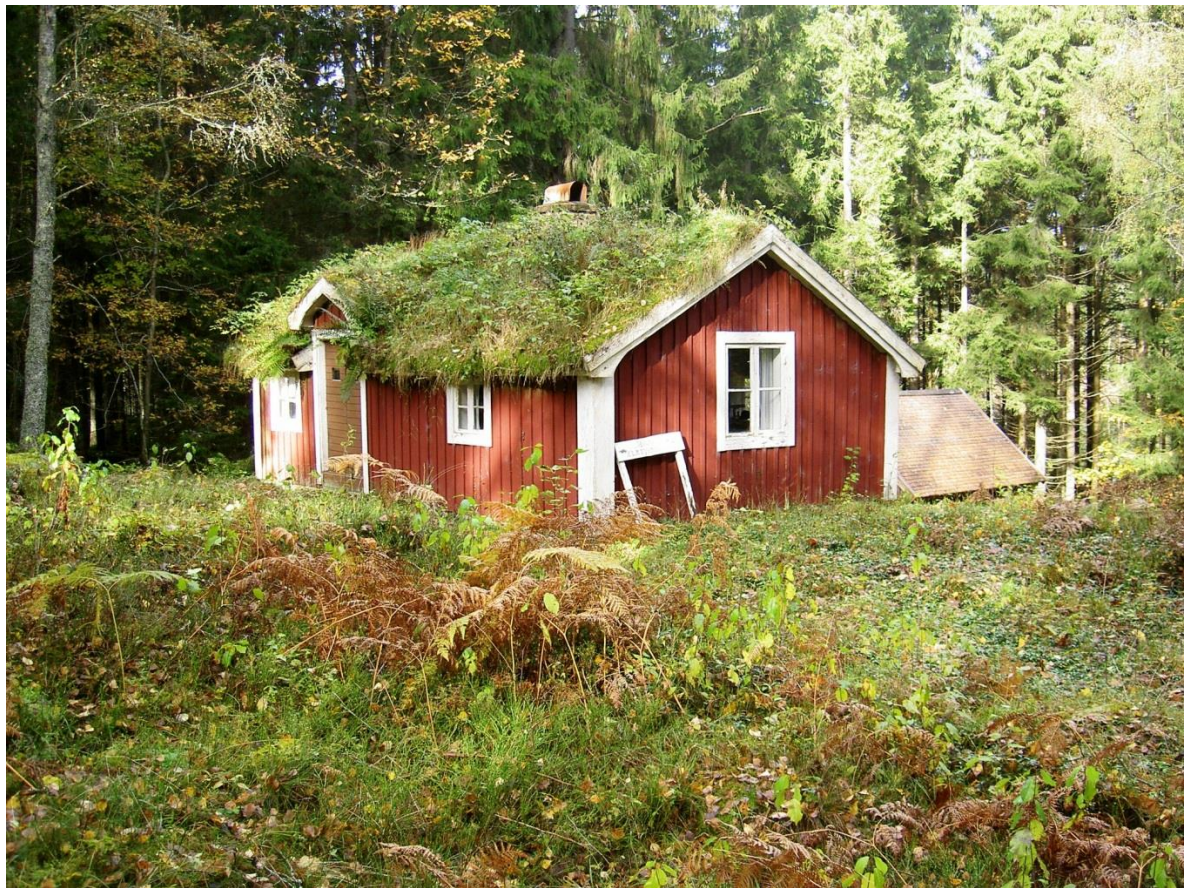
"Kålla-Haukene- Stugan" utifrån år 2011. Omfattande tak- och fasadrenoveringar har utförts år 2016.