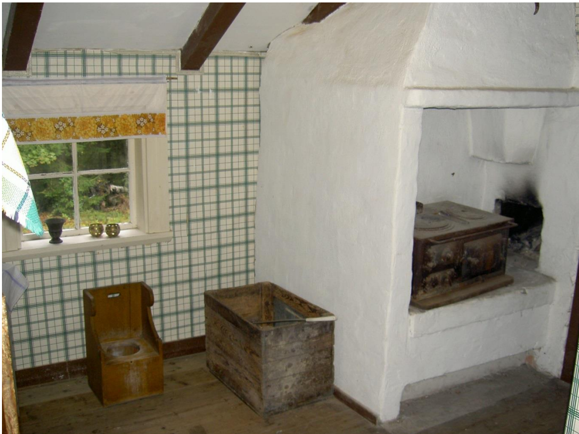
Köket mot öster. Tidigare fanns bakugn som utbyggnad på långsidan- endast stengrunden finns kvar.