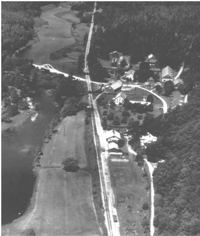
Flygfoto omkring 1945

Enskifte ägde rum i Hofmansbygd 1825-26. I byn, som var 2/3 mantal kronoskatte, fanns tre gårdar, varav en hade två lotter. Två gårdar stannade kvar på sina gamla platser medan den tredje utflyttades. Byns totala areal var 1.257 tunnland varav vägar, bäckar och halva Mörrumsån utgjorde 30 tunnland.