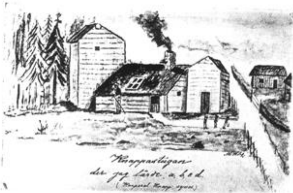
Knappastugan der jag lärde a, b, c, d. (Korpral Knapp synes.)