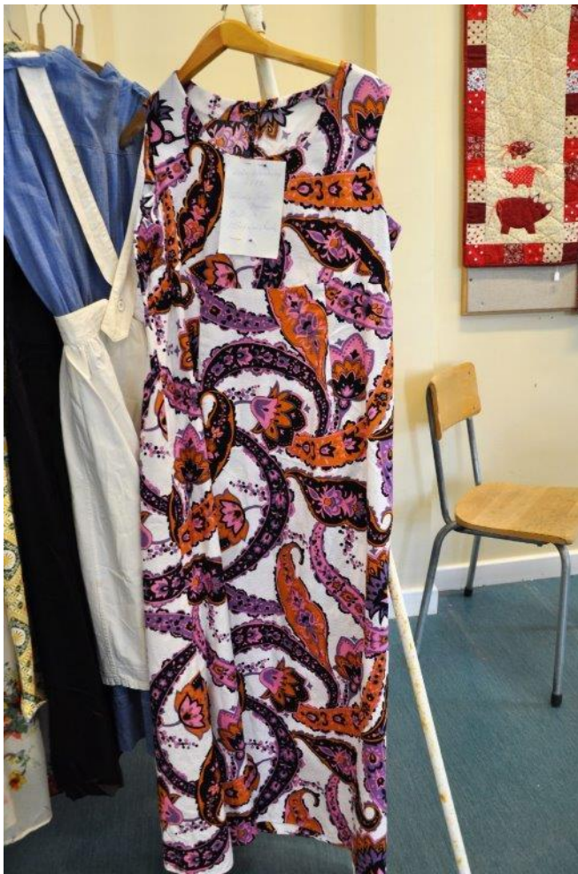
En klänning att dansa i ! (från RödaKorsets klädotställning)