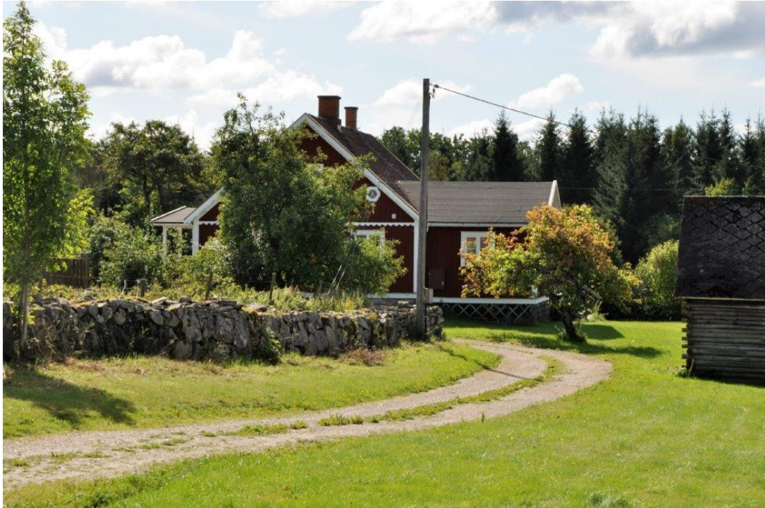
Faster Linneas hus, Letesmåla