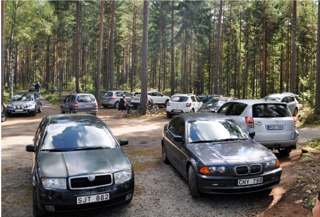
P-avgift nästa år !!!