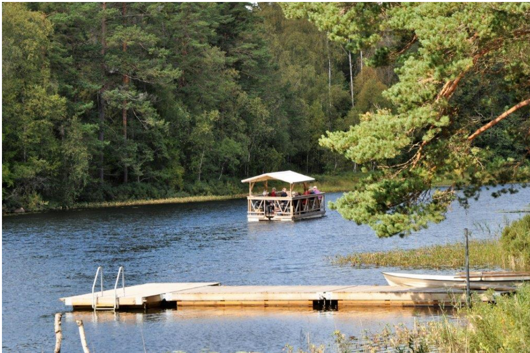
Flott flytetyg far Fritzö förbi