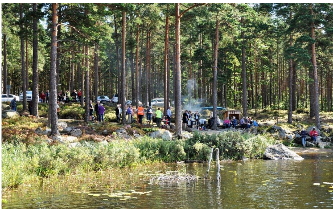
Trivsamt vid Öjasjön