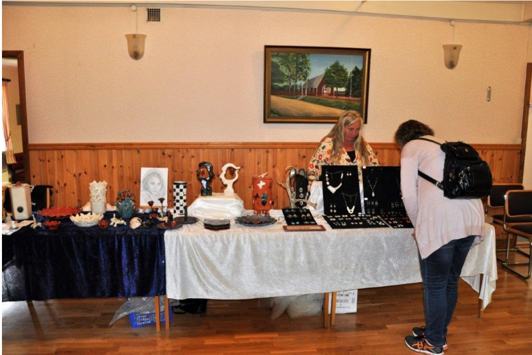
Vuxenskolan visar keramik och smycken