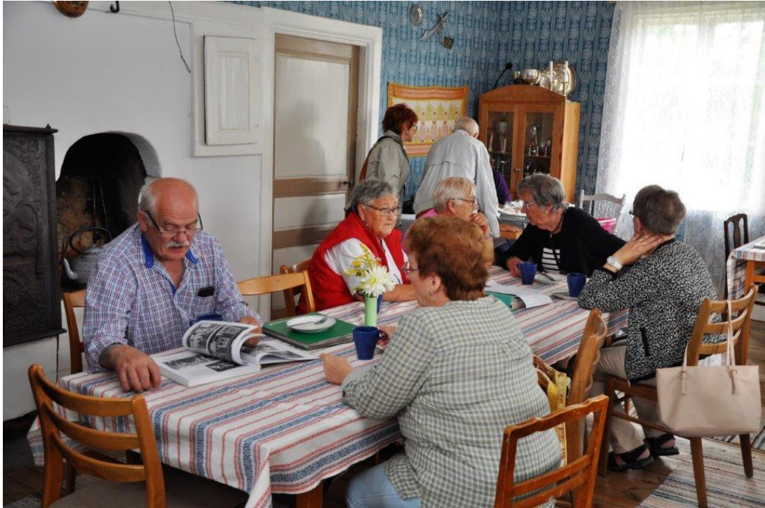
I väntan på fika studeras hembygdens historia i nya Ringamålaboken.