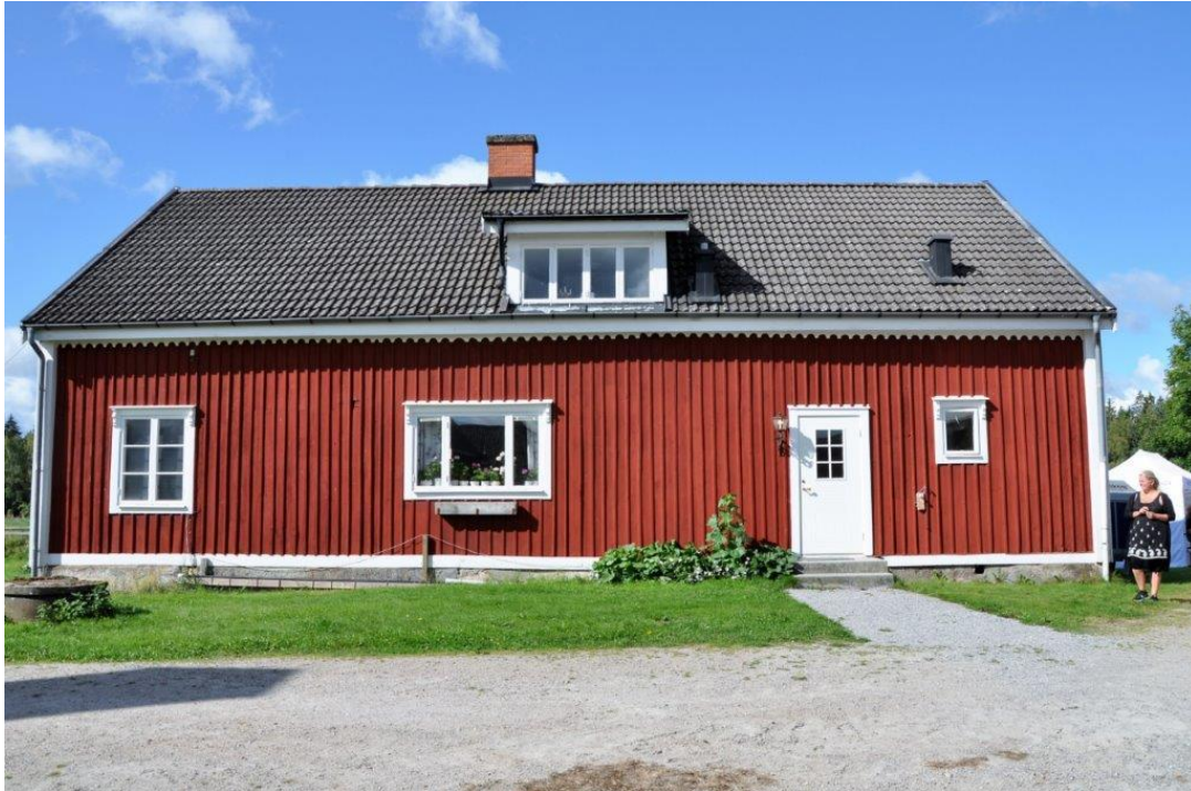
Boningshuset Letesmåla gård