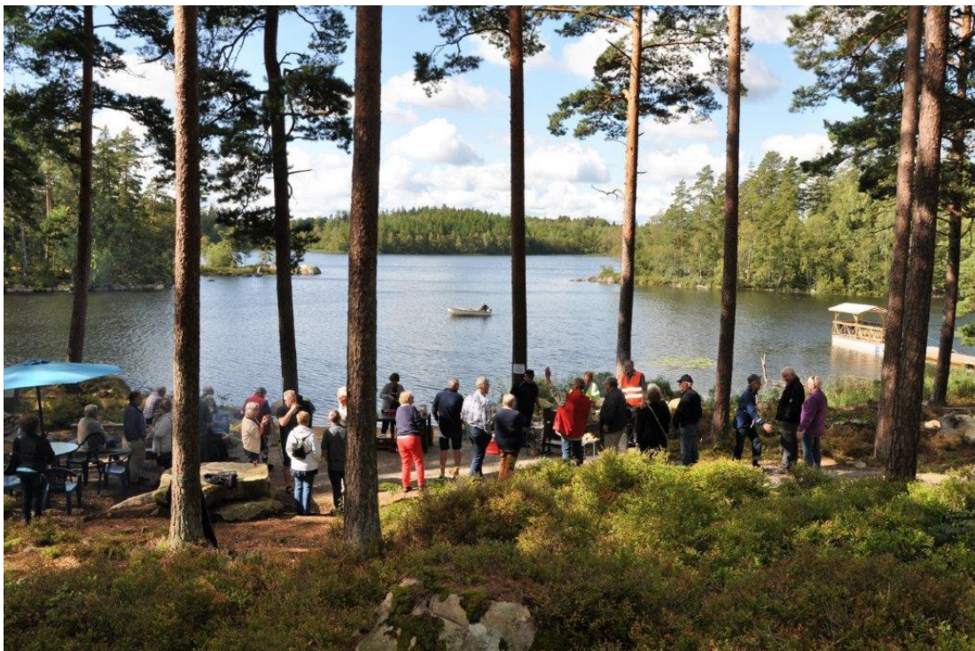
Öjasjön = dragplåster