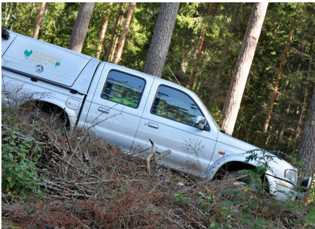
Här går det visst utför