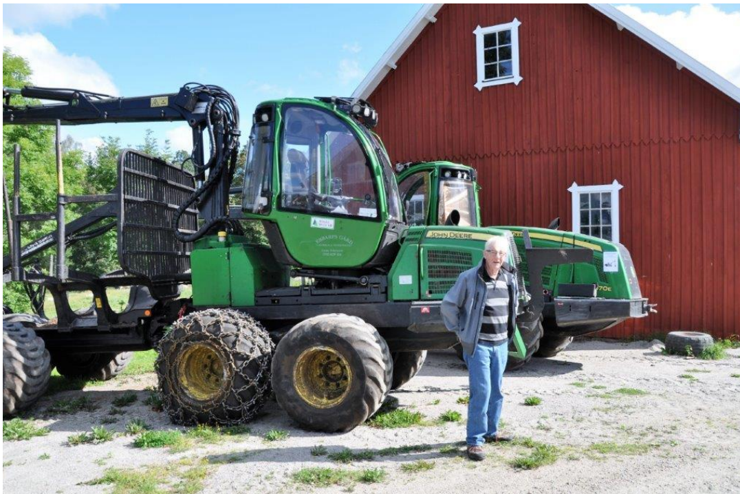
Stora maskiner från Rönås Skog