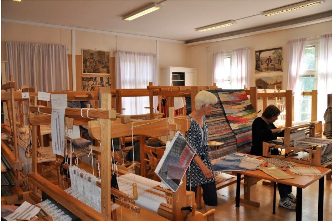
Vävstugan i Byahuset