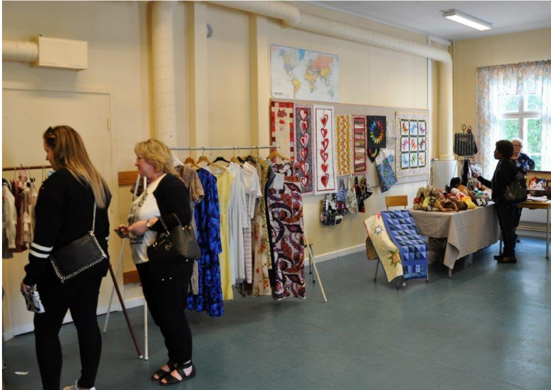
Gamla kläder – men inte för alla väder ! (från RödaKorsets klädotställning)