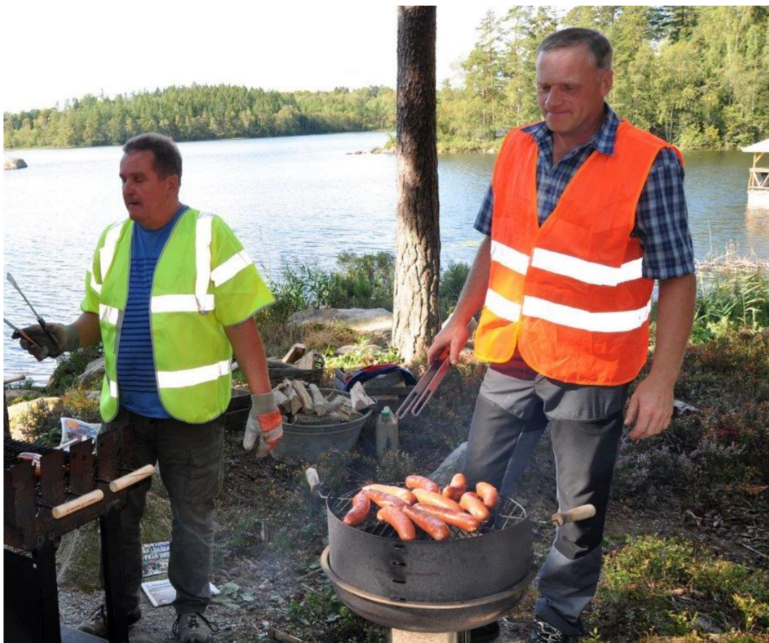
Med stöd av Tomas P