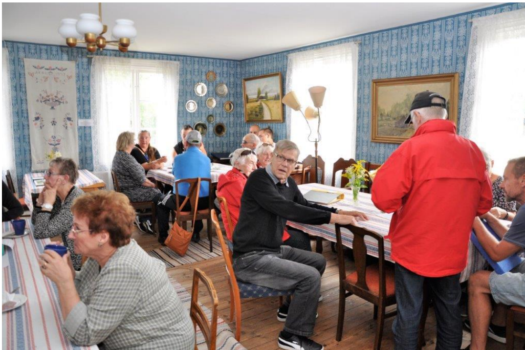
Nissagården lockar med kaffe och våffla!