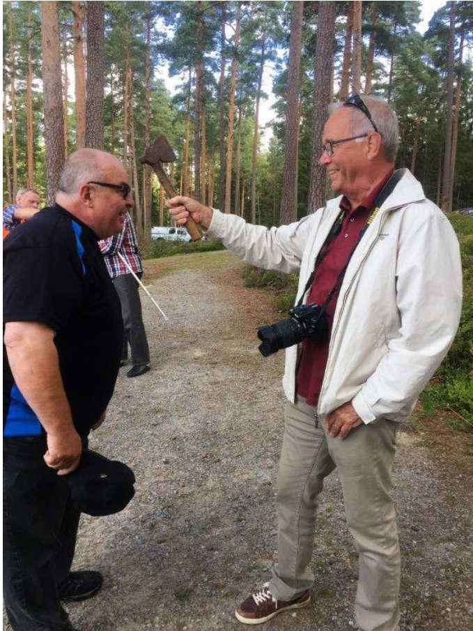
Test av Kalla-Haukna yxhammare