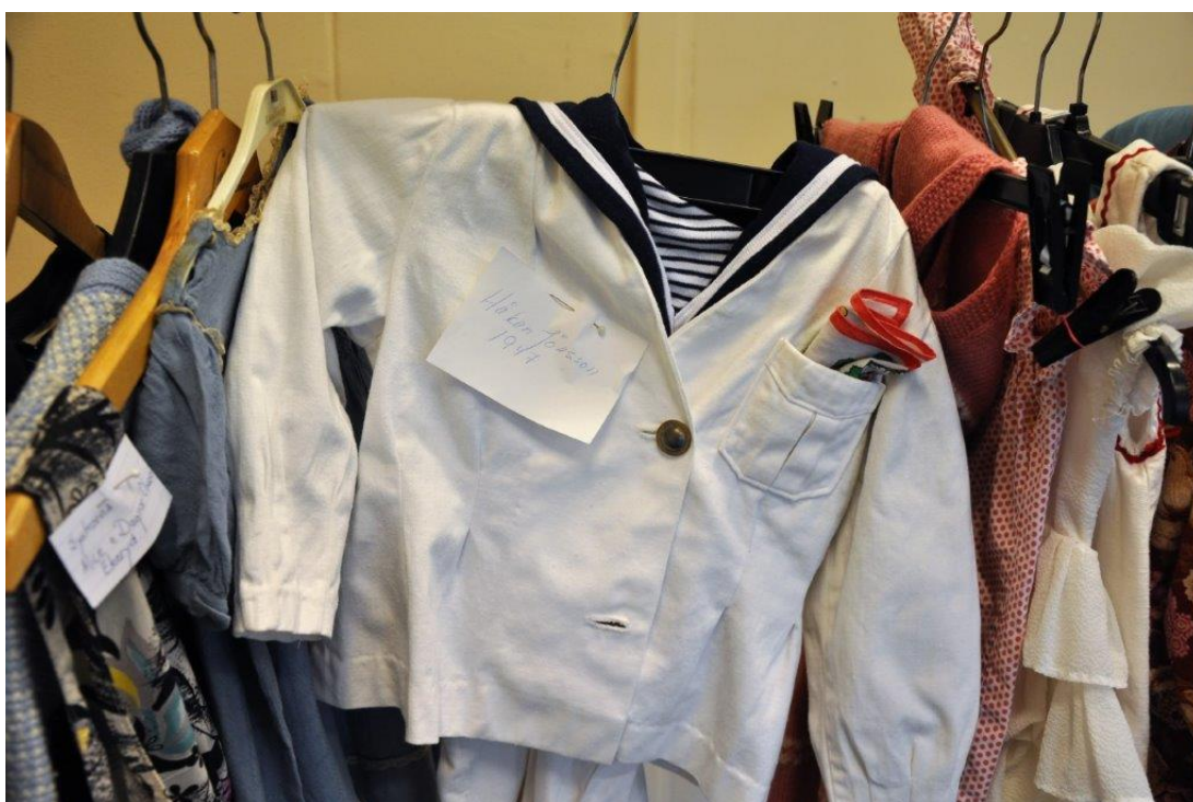
En bygdens son, men sjöman blev han inte (från RödaKorsets klädställning)