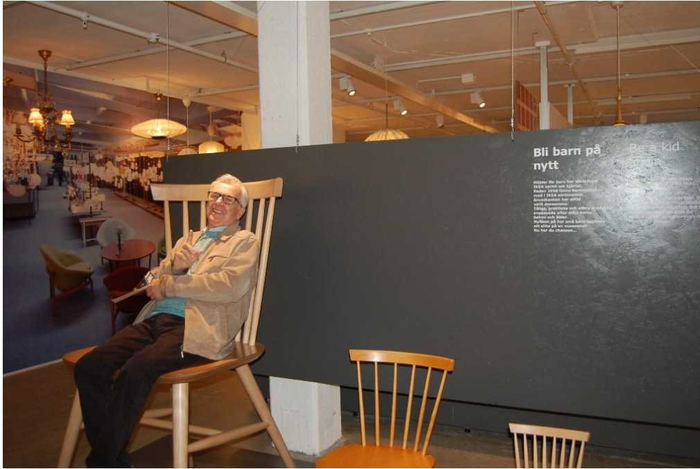
Många trevliga miljöer och minnen som väcktes till liv vid rundvandringen på Kamprads museum. Många av oss minns 50-60 talets möbler från IKEA i vardags och TV rum. Första varuhuset byggdes i Älmhult sen Oslo i Norge , Kungens Kurva Stockholm , Sundsvall osv.