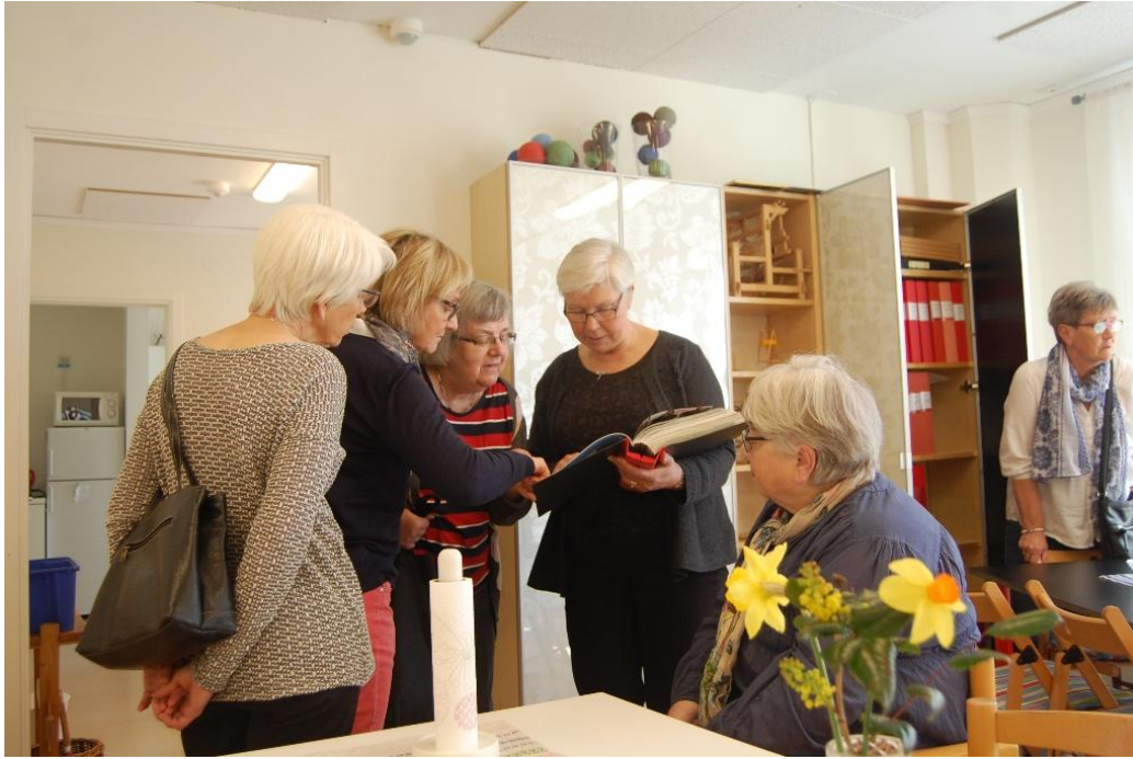
Här studeras vävnoter av deltagarna.