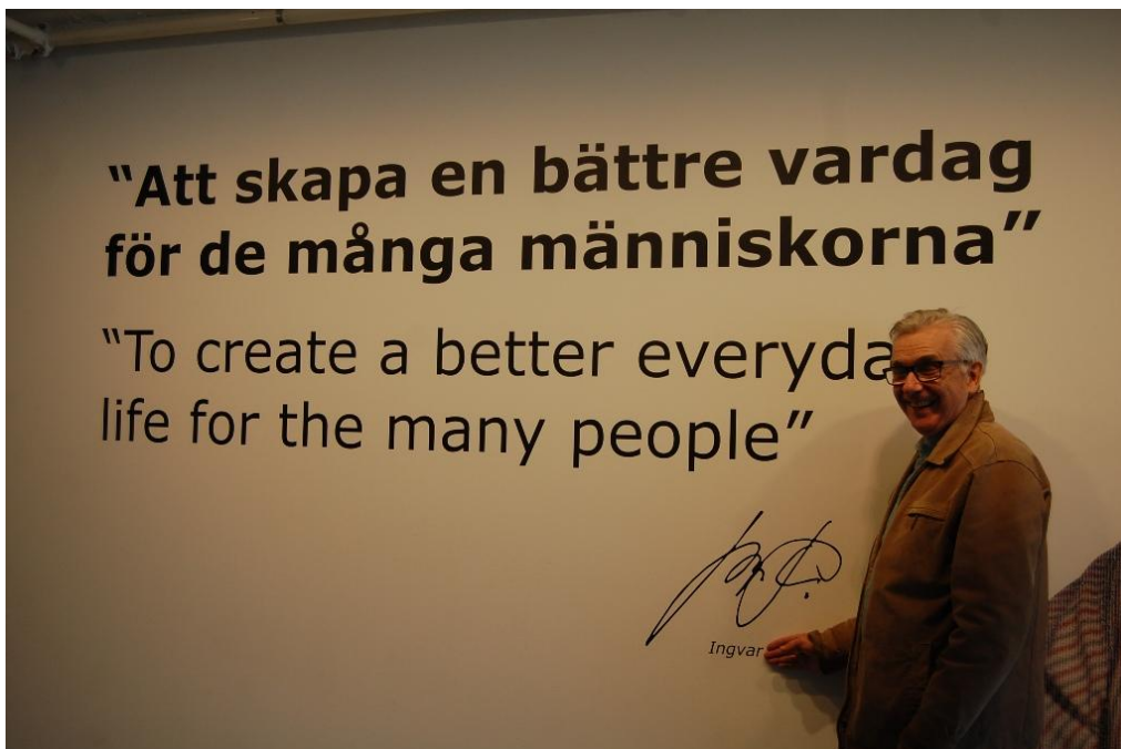
Deltagare i utflykten och fotograf för dagen, TACK Ingvar för bilderna !!

Artikel/Ingrid o Nils-Erik Svensson, Bilder: Ingvar Nilsson