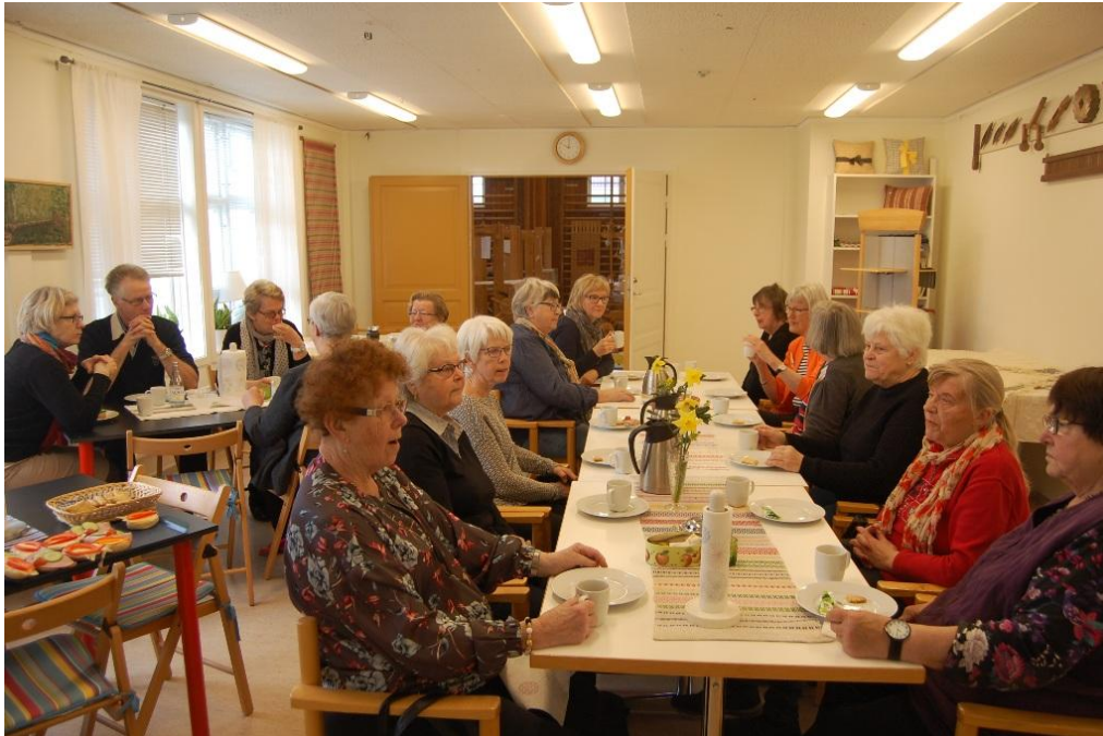
Vi blev bjudna på hembakade frallor och god kaka till fikat, gott och trevligt.