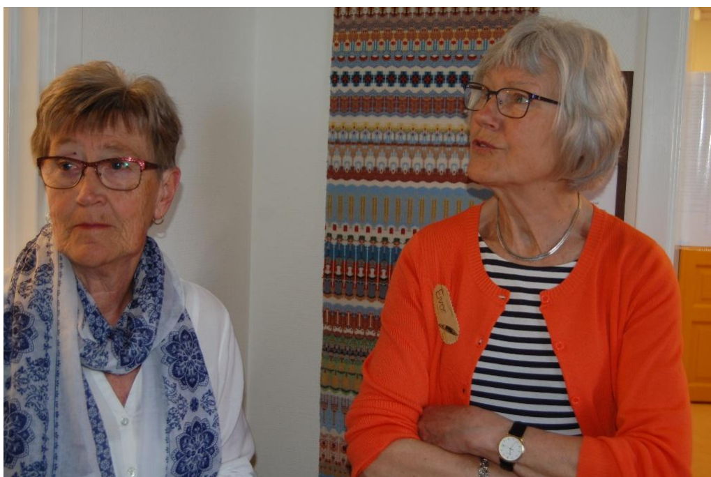
Våra duktiga och trevliga guider i Stinsens vävstuga