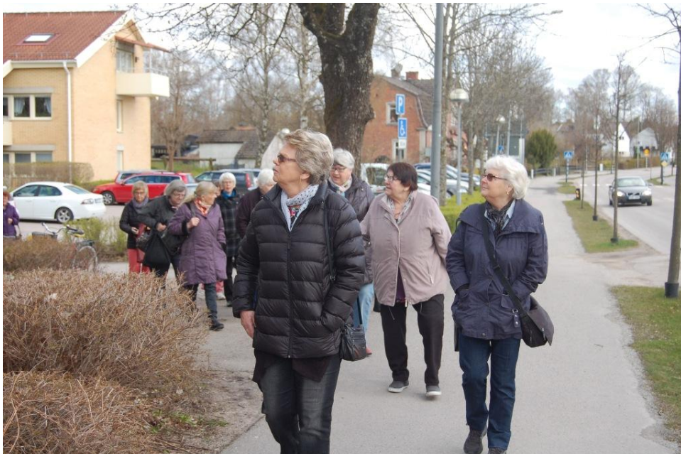
Första stoppet var Stinsens vävstuga i Älmhult , där vi bokade in oss för studiebesök och fika.