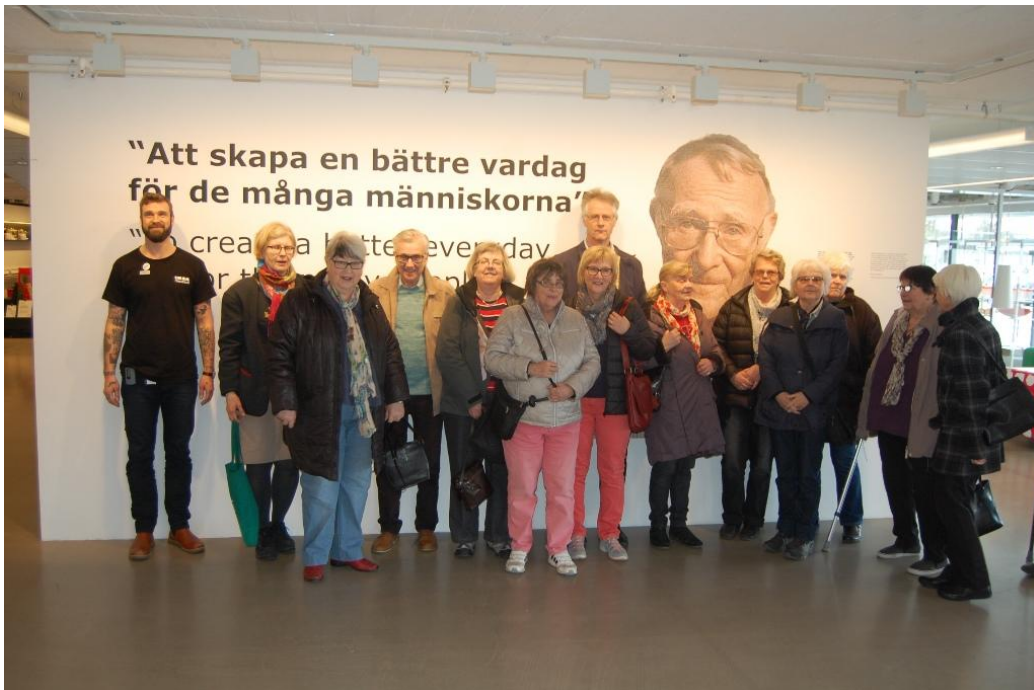
Nästa stopp i Älmhult var IKEA museet , där vi även passade på att äta lunch som givetvis bestod av köttbullar som är IKEAs koncept.