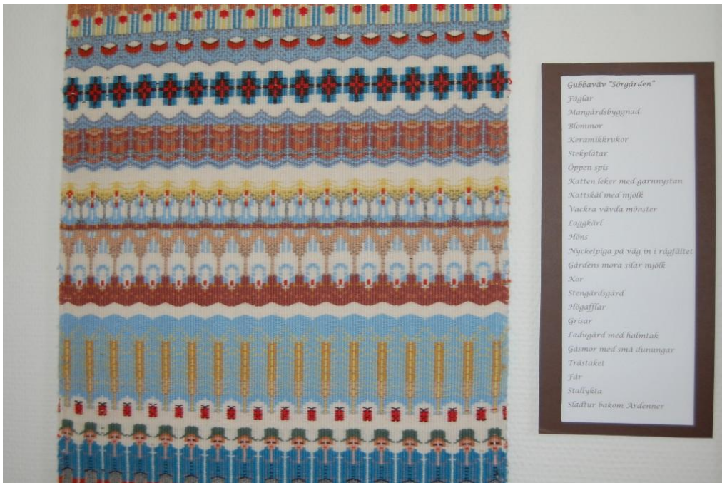
Detta är ett sk gubbatäcke som symboliserar olika moment i vävningen